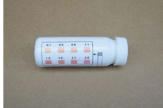
Las tiras de prueba