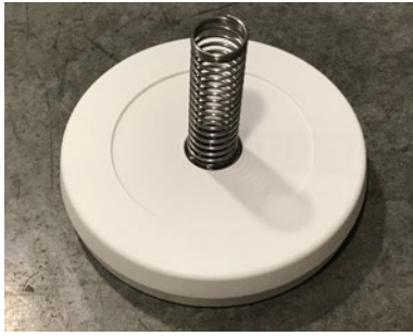
Unidad con resorte