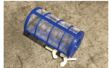
Malla protectora del anodo

Desenvuelva el paquete y saque todo su contenido. Recuerde que debe revisar bien dentro por si quedan piezas sueltas. Lea todas las instrucciones antes de proceder con el armado: