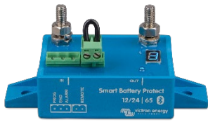
Smart BatteryProtect BP-65