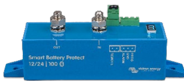
Smart BatteryProtect BP-100