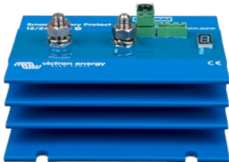
Smart BatteryProtect BP-220